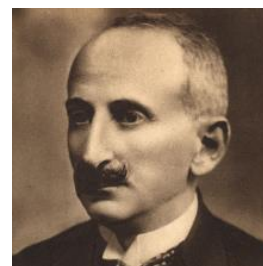
Bolesław Leśmian (1877–1937) – poeta, prozaik, eseista, krytyk literacki, czołowy przedstawiciel literatury dwudziestolecia międzywojennego.

Kroki moje już dudnią po grobli – nad rzeką. Słysząc je tak daleko! Tak cudnie daleko! A teraz – bieg z powrotem do domu – przez trawę – I po schodach, co lubią biegnących stóp wrzawę... I pokój, przepełniony wiosną i upałem, I tym moim po kątach rozwłóczonym ciałem – Dotyk szyby – ustami... Podróż – w nic, w oszklenie – I to czujne, bezbrzeżne z całych sił – istnienie!