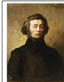
Adam Mickiewicz (1798–1855) – jeden z najwybitniejszych poetów polskich, działacz polityczny, publicysta.

Moskwa mnie uważała gwałtem za stronnika, Dano Soplicom znaczną część dóbr nieboszczyka, Targowiczanie potem chcieli mnie zaszczyścić Urzędem. Gdybym wtenczas chciał się przemoskwicić!